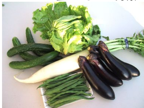
たからだの里 おまかせ野菜セット ¥500