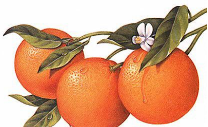
マーマレード・イチゴジャム 各 180g ¥250

財田町大地の会の、マーマレードとイチゴジャムのご紹介です。甘くておいしいマーマレードとイチゴジャム、先日試食をしましたが、素材本来のおいしさを十分にひきだしています。これは本当におすすめですよ！！