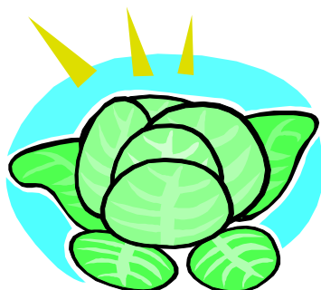
ラフレタス(玉レタス) ¥160

小松菜が御好評いただきました三豊セゾンの、レタスですよ！有機質肥料を中心に減農薬栽培。瑞々しいシャキシャキした食感をお楽しみください。